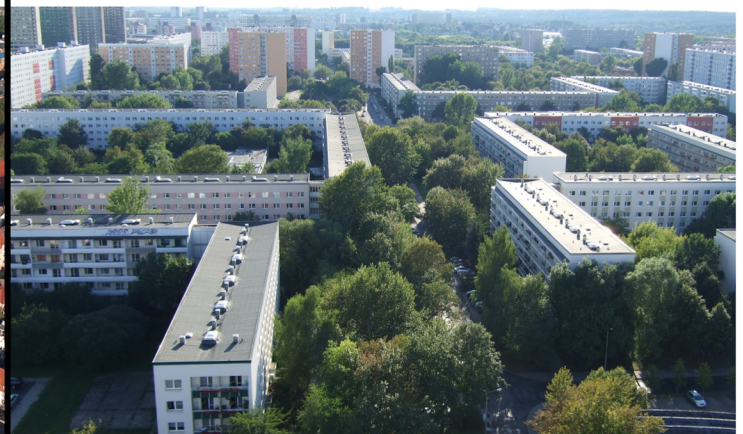
Halle-Neustadt, Halle (Saale)

Nun ist es aber so, und ich spreche aus Betroffenheit und Erfahrung, dass ein Teil der Mittelschicht oder sollte ich sagen, Teile des aufstiegsorientierten bildungsbürgerlichen Milieus, die in der Nachkriegszeit über Bildung bzw. das Abitur den sozialen Aufstieg in akademische Berufe geschafft haben, dass diese Gruppe der Nachkriegsjugend dann auch in