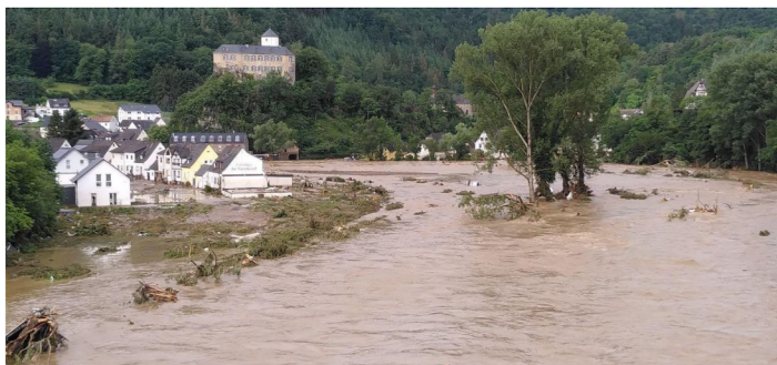
Hochwasser im Ahrtal, 2021

„Mensch“ haben und sich dem Thema „Menschenbild und Menschenrechte“ zuwenden (vgl. auch die Vorschau in diesem Heft).