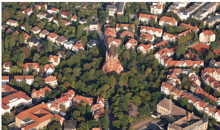
Paulusviertel, Halle (Saale)