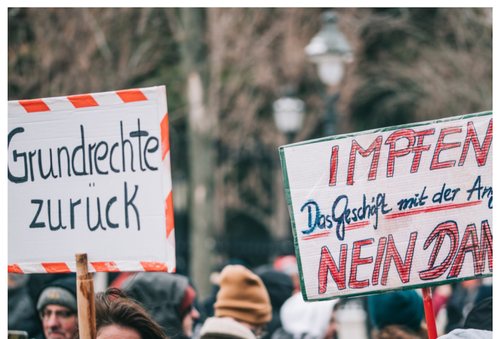
Demonstranten bei einer Anti-Corona-Demo

In Form von subjektiv ausgewählten Zitaten will ich die Intention des Buches aufzeigen: „Zwar verzeichneten alle Stände damals zahlreiche Todesopfer, den materiell bessergestellten Adeligen und Grundgrundbesitzern gelang es aber eher, von der Pest verschont zu bleiben“ (S. 14); „Die Tuberkulose war, stärker als andere Infektionskrankheiten, eine klassenspezifische Krankheit, eine Krankheit der Unterschichten“ (S. 19). Im Winter 2019/2020 „fehlte es an Personal und Material in den Krankenhäusern, die man in Profitmaschinen verwandelt hatte, ebenso wie in der Altenpflege“ (Bertz, S. 45); „Große Industriebetriebe wurden nicht vom Lockdown erfasst und zur Schließung gezwungen.